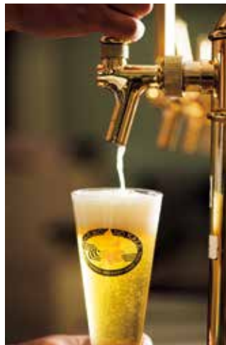
サーバーからサービングされる地ビール。 きめ細かな泡と発泡感がたまらない