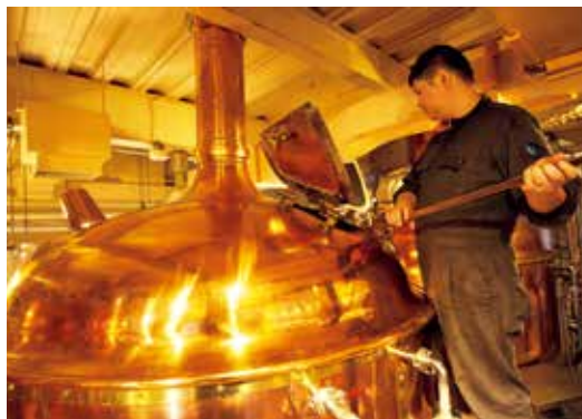
4000Lの醸造用タンクで仕込み作業中

仙南の田園風景を進んでいくと、かわいいた屋が印象的なヨーロッパ風の建物が現れます。ここが角田の「仙南シンケンファクトリー」。仙南クラフトビールを知って、わざわざ東京からも地ビールファンが訪れる人気店です。中央の入り口から入れば、一方はレストラン、一方はファーマーズマーケット。レストランの中もヨーロッパ調の落ち着いた華やかさがあり、ガラス越しに見える醸造所の風景は異国情緒たっぷりです。「仙南クラフトビール」は、原料の麦芽とホップはヨーロッパ、酵母は世界最古の修道院醸造所由来のもので造られます。近年、日本地