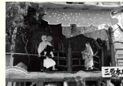
昭和30年当時の仕掛け物。義経と弁慶が五条大橋で立ち回り、といった演目だろうか

撮影者の中嶋さんは「あの頃はアーケードがないから青空がそのまま見えて、風が吹き抜けるととても清涼感がありました。でも雨が降ると店の人たちは大変そうで」。慌てて片付けた