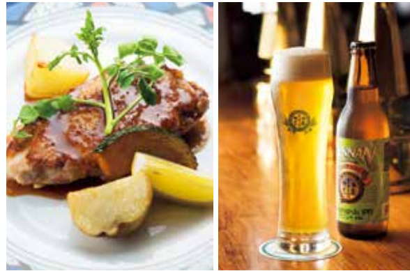
右/フルーティーな香りと深いコクが楽しめる、角田産ササニシキ使用の「ササニシキIPA」(330ml 540円) 左/宮城蔵王産ジャパニーズポークロースのソテー(ライスかパン、スープ、サラダ、デザート付き 1,250円) ※価格は税込

ビール協会が主催するインターナショナル・ビアカップで5年連続受賞。定番5種類の中でも特におすすめは、角田産ササニシキを使用した「ササニシキIPA」です。IPAとはインディア・ペールエールの略で、3種のホップをふんだんに使って苦味と香りを効かせたビールのこと。宮城県ではレギュラーで造っているところが少ない希少なビールです。料理には地元の食材を積極的に使用。蔵王の銘柄豚の美味しさが際立つ「宮城蔵王産ジャパニーズポークロースのソテー」は、豊穣なビールタイムをいっそう味わい深いものしてくれます。阿武隈急行線の角田駅から徒歩3分の近さ。電車を利用した「ちよい旅+地ビール」も乙なものです。