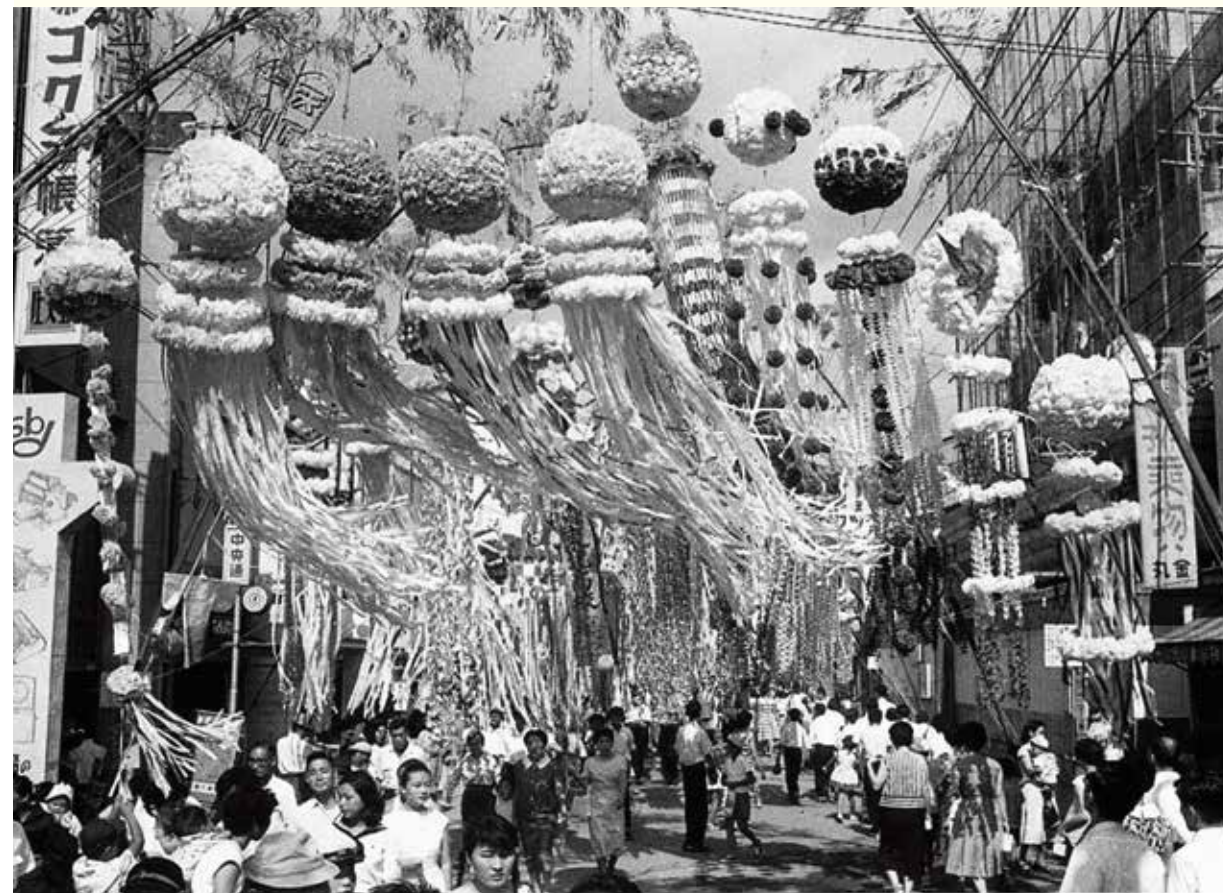
大勢の人でにぎわう仙台市中心部の中央通り。飾りも簡単なものから凝ったものまでさまざま

七夕といえば、子どもの頃の夏休みの思い出と結びついている方も多いのではないだろうか。大きな写真の仙台七夕まつりの風景は、昭和30年に中央通りで撮影されたもの。並んだ吹き流しが一斉に右へ流れる様子は、風が吹き過ぎる瞬間が見えるような気持ちにさせられます。